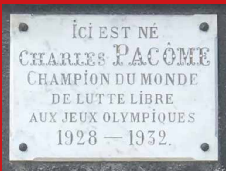
Plaque sur la maison natale