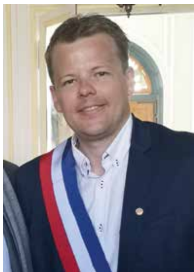
Paul-Loup TRONQUOY Maire de Bergues